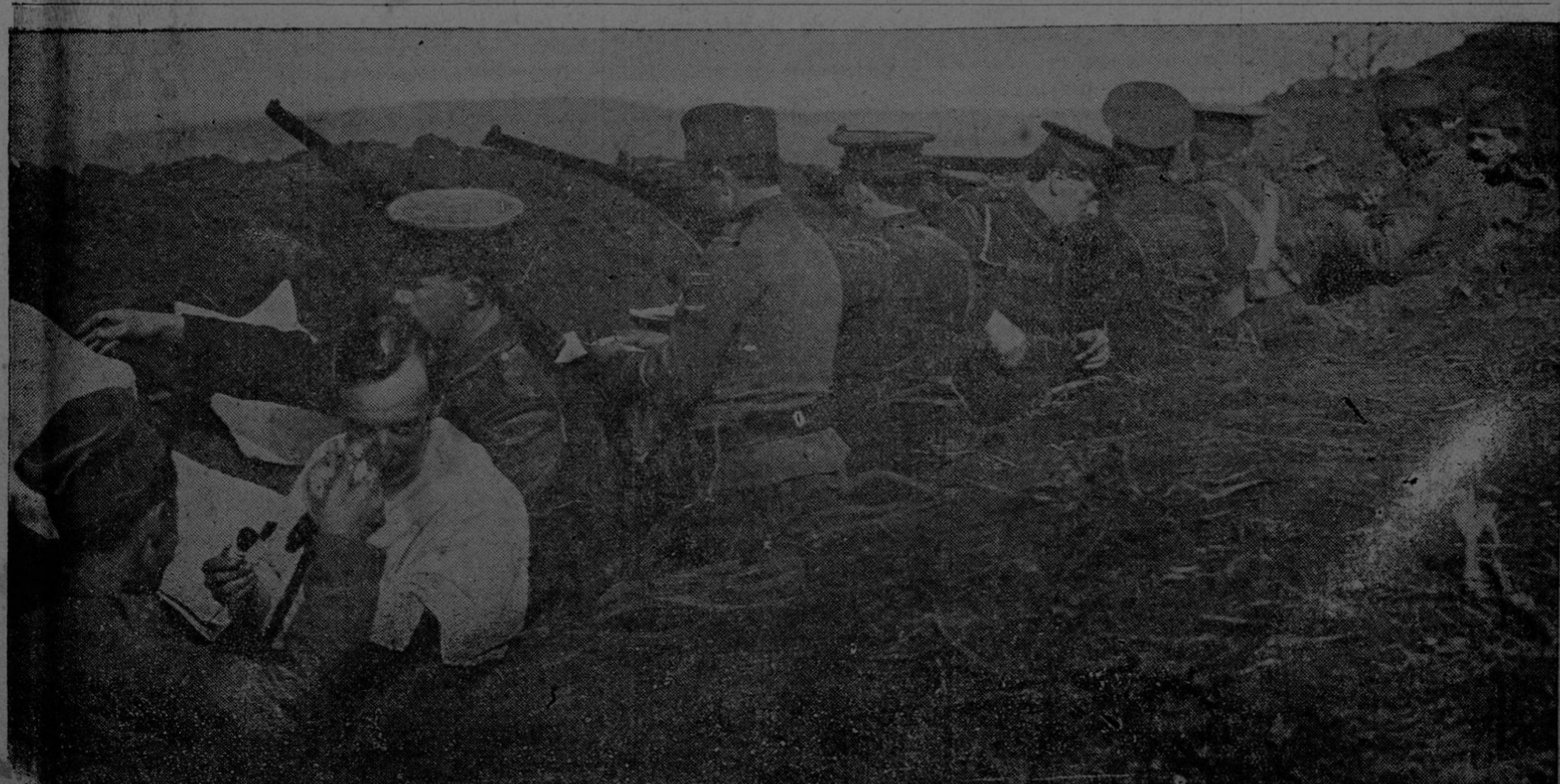
Interesante fotografía tomada en la frontera serbia, que muestra a los marinos ingleses y a la infantería serbia, lado por lado en las trincheras, oponiéndose a la invasión austro-germana y búlgara. Nótese que un marino inglés ha sido herido.

Estos son hechos y no palabras. No es con editoriales lacrimosos y difamatorios como se reconquista el estandarte, sino mejorando continuamente el periódico hasta hacerlo digno de nuestro público.